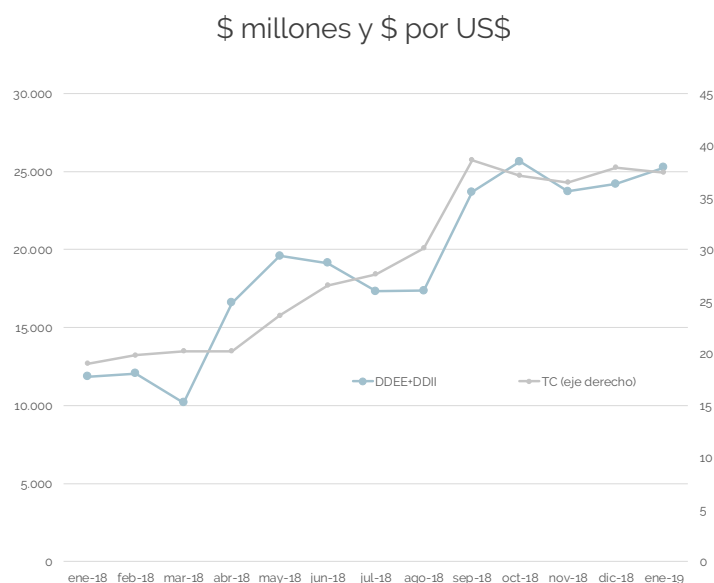
Gráfico 2: Recaudación por Derechos sobre el comercio exterior y tipo de cambio