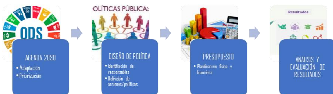
Figura I. Diseño de Política en base a los Objetivos de la Agenda

Un ejercicio de vinculación presupuestaria de este tipo podría reflejarse en un esquema como el que se expone en la Figura I.